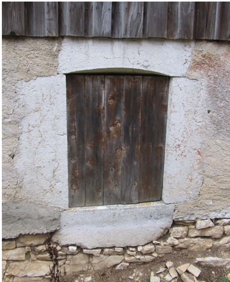
Fenêtre de l'habitat.