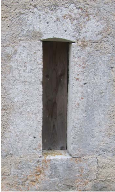
Bornatz de ce qui était probablement la chambre à lait.