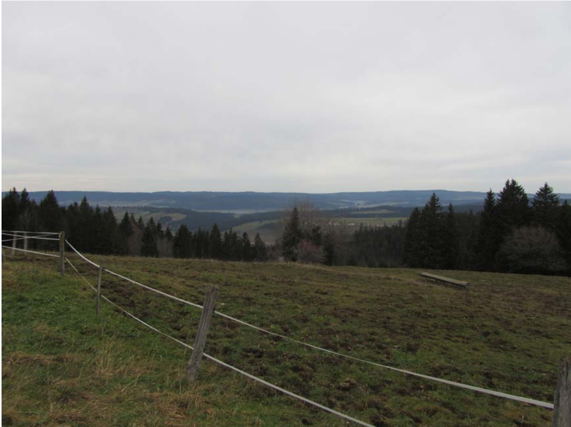
Telle est la vue, depuis Bellevue. Ciel gris, couleur fortement atténuée, ce ne serait pas l'heure pour des photos.