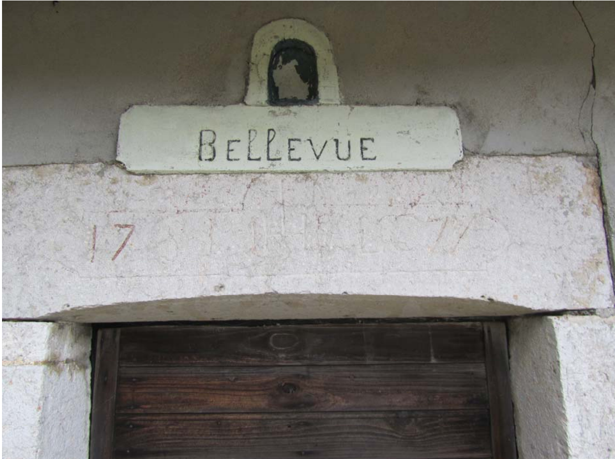
Construction très soignée de 1777. Initiales illisibles.