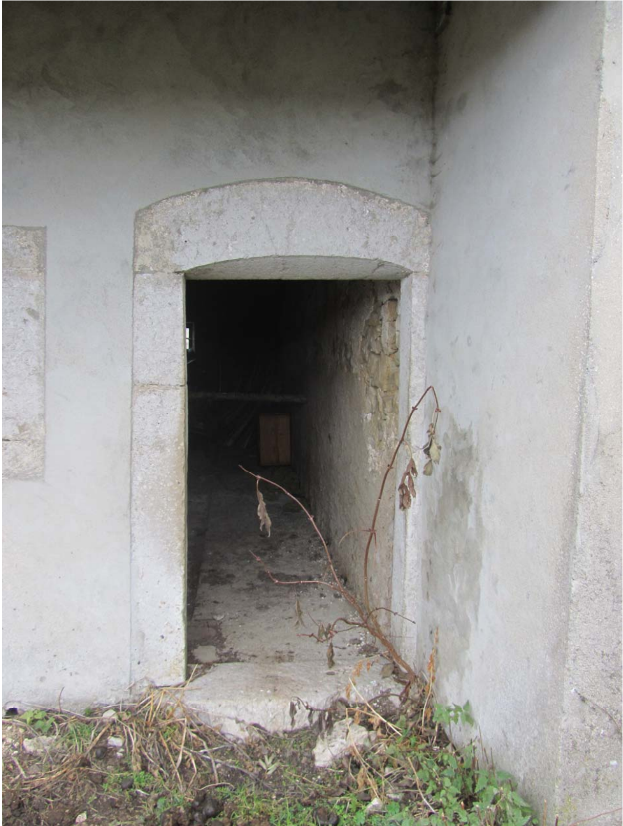
Porte sur l'arrière de la maison. Tout cela ne paie pas trop de mine, et pourtant ces éléments sont beaux. On admirera particulièrement ce linteau de porte avec sa taille en biseau qui évitera peut-être aux trop grands de se fracasser le crâne !