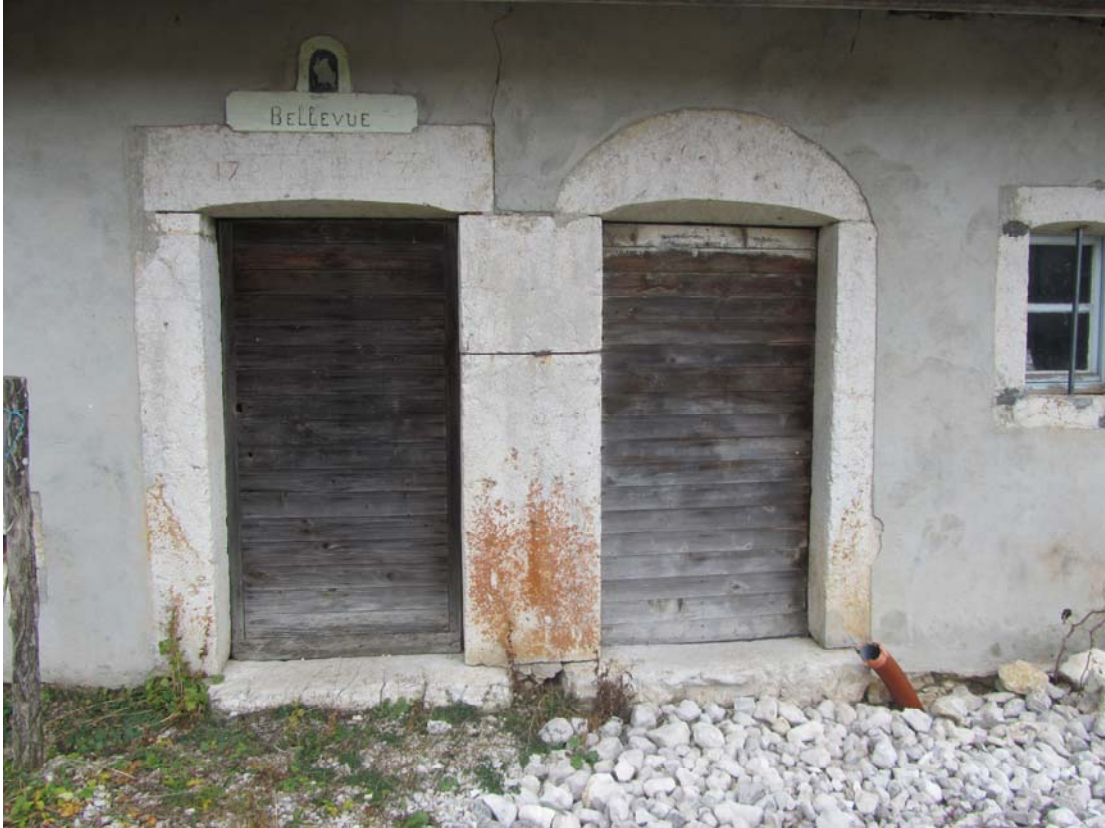
Superbe entrée, à gauche l'habitat, à droite le rural.