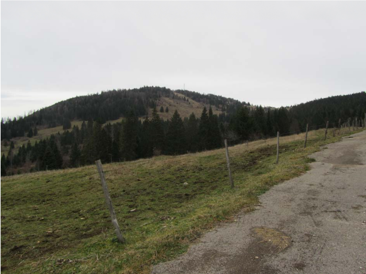
De Bellevue, vue sur le Mont Rond, d'une altitude de quelque 100 m inférieure à celle du sommet du Mont d'Or.